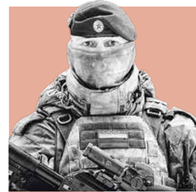
«ХАН» (ПОЗЫВНОЙ) , военнослужащий Северо-Западного округа Росгвардии

Недавно проходили мимо церкви. Решили зайти, поставить свечку, послушать службу. Среди нас был и мусульманин. Сначала он хотел подождать на улице, потом, когда объяснили, что никто его из православной церкви никогда не погонит, зашел с нами. Стоял, слушал внимательно и уважительно. Так приходит понимание единства народа перед лицом Бога.