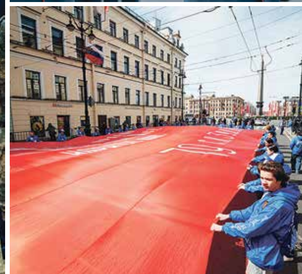
Председатель городского парламента Александр Бельский и губернатор Александр Беглов