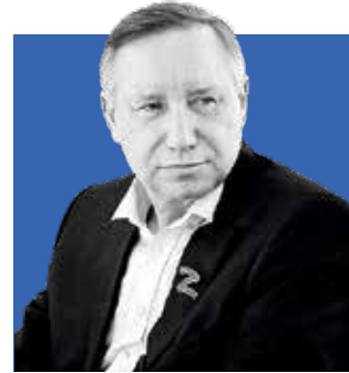
АЛЕКСАНДР БЕГЛОВ, губернатор Санкт-Петербурга

О традициях, которые связаны с великим праздником