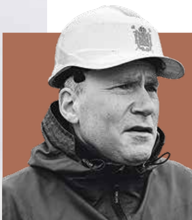
АЛЕКСЕЙ МИХАЙЛОВ, председатель Комитета по государственному контролю, использованию и охране памятников истории и культуры