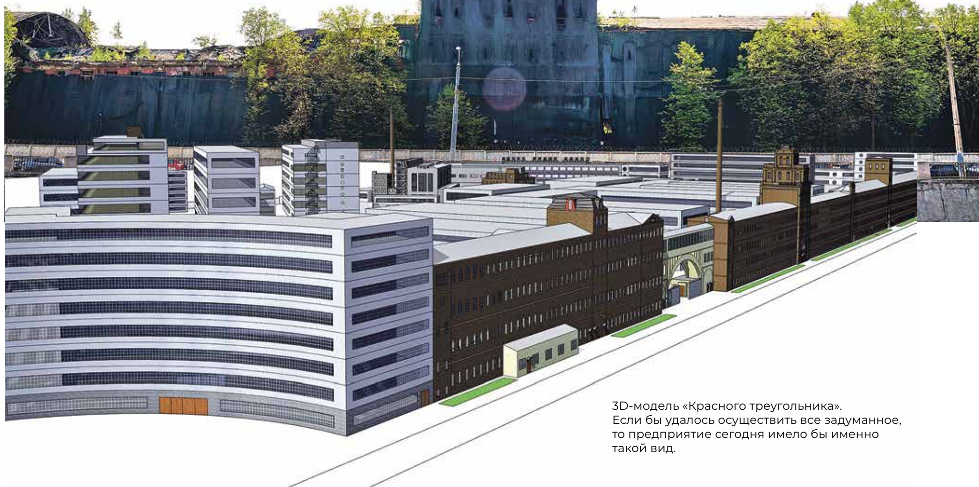
3D-модель «Красного треугольника». Если бы удалось осуществить все задуманное, то предприятие сегодня имело бы именно такой вид.

ного корпуса с дымовой трубой. Границы территории, уходящие от набережной вглубь завода, имеют сплошную линию из новых корпусов.