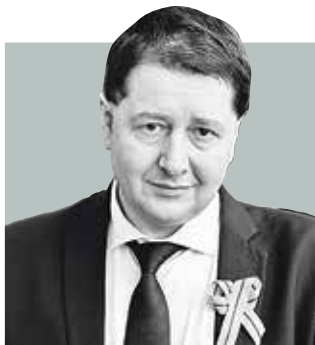
ВАЛЕНТИН СИДОРИН, проректор Санкт-Петербургского государственного педиатрического медицинского университета

Чтение, самовыражение через искусство и волонтерская деятельность: накануне праздника в эфире «Радиоклуба на Карповке» обсудили, чем юные жители Петербурга могут занять себя во время наступивших летних каникул.