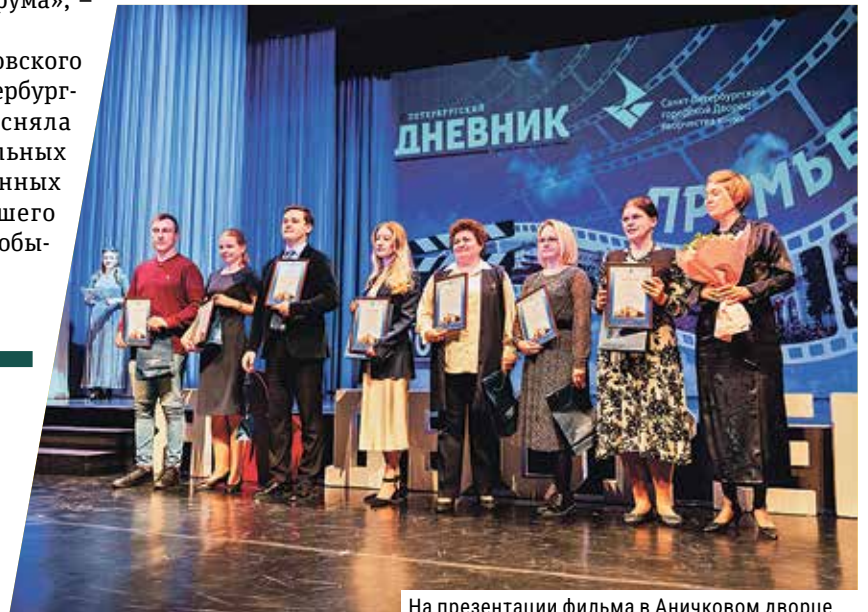
На презентации фильма в Аничковом дворце