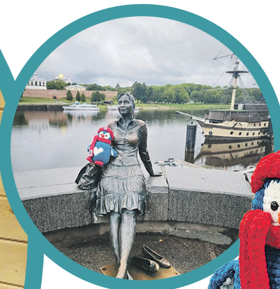
Памятник туристке в Великом Новгороде