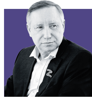
АЛЕКСАНДР БЕГЛОВ, губернатор Санкт-Петербурга

Чтобы каждый ребенок раскрыл свои таланты