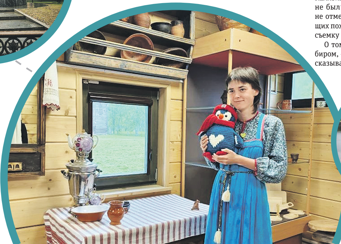
Музей народного деревянного зодчества «Витославицы»