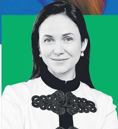
ЕЛЕНА РАЗУМИШКИНА, председатель Комитета по молодежной политике и взаимодействию с общественными организациями