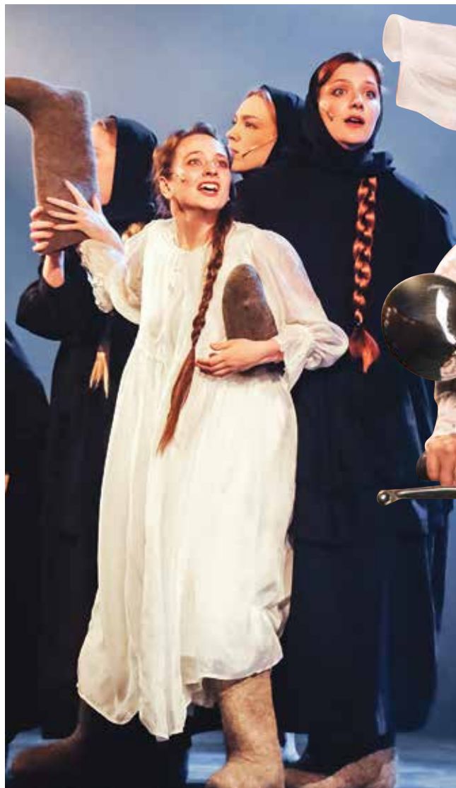
«Евгений Онегин. Сон Татьяны», Алтайский государственный театр для детей и молодежи им. В. С. Золотухина (Барнаул)