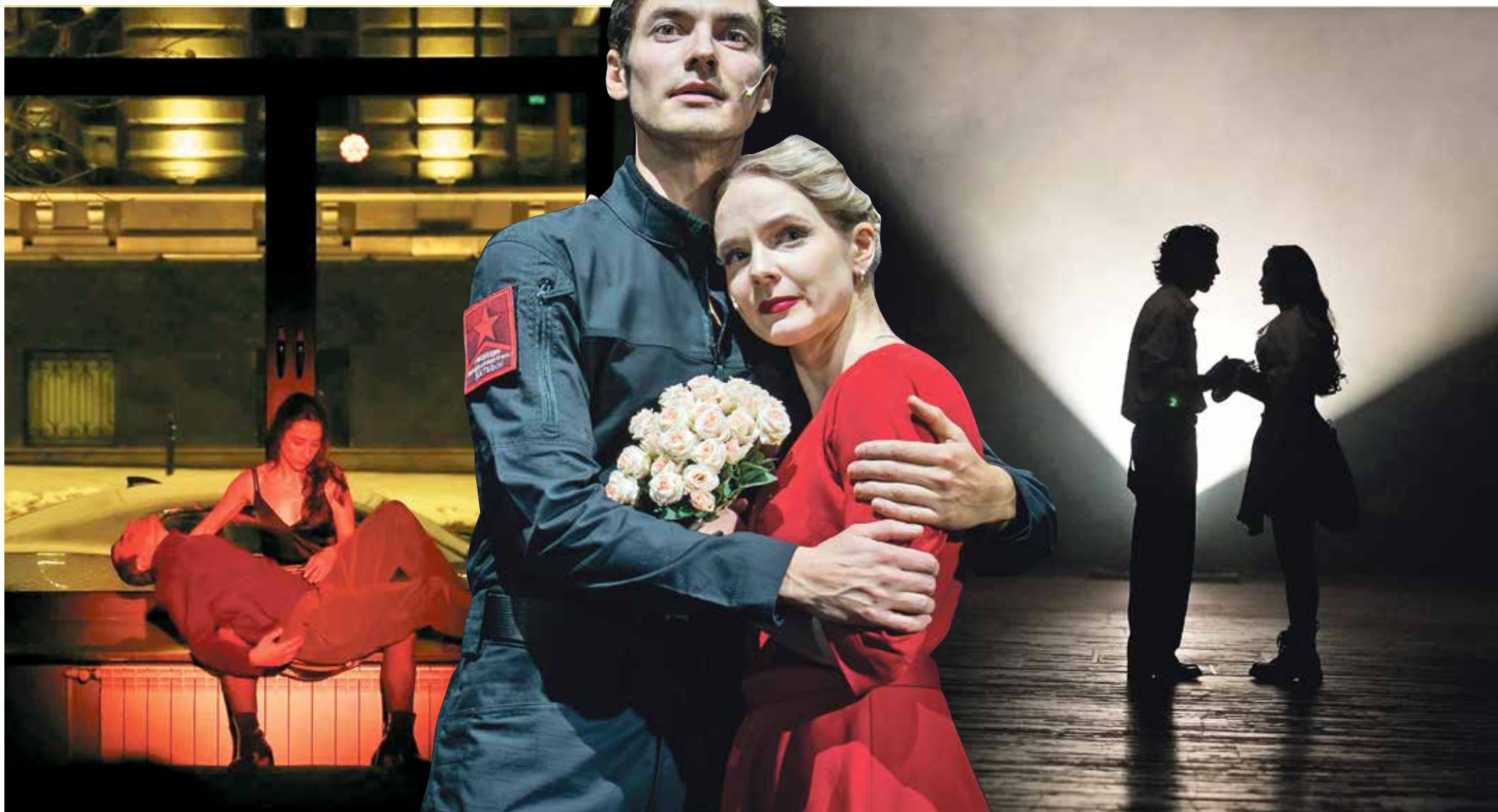
«Если бы ты умер», Ереванский артистический театр им. М. Мкртчяна (Армения)