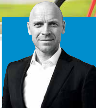
АНТОН ШАНТЫРЬ, председатель Комитета по физической культуре и спорту