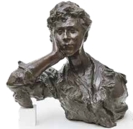
П. П. ТРУБЕЦКОЙ. ПОРТРЕТ КНЯГИНИ М. К. ТЕНИШЕВОЙ / ГРМ