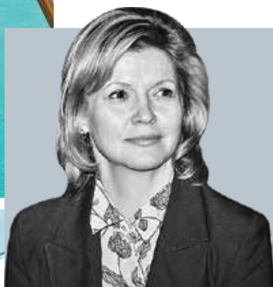
ЕЛЕНА ФИДРИКОВА, председатель Комитета по социальной политике Санкт-Петербурга