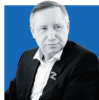
АЛЕКСАНДР БЕГЛОВ, губернатор Санкт-Петербурга