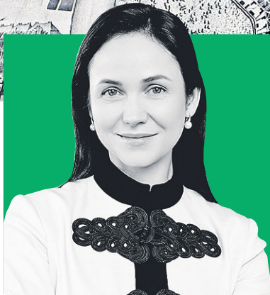
ЕЛЕНА РАЗУМИШКИНА, председатель Комитета по молодежной политике и взаимодействию с общественными организациями