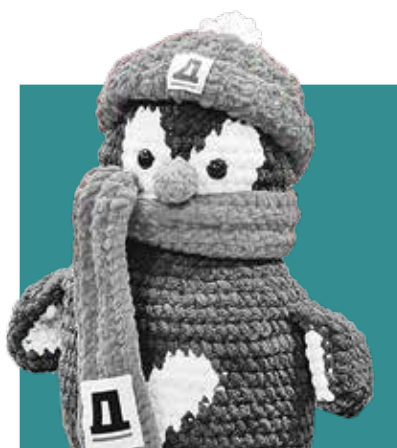
ПЛОМБИР , пингвин, талисман «Петербургского дневника»

П ривет, друзья! На связи пингвин Пломбир.