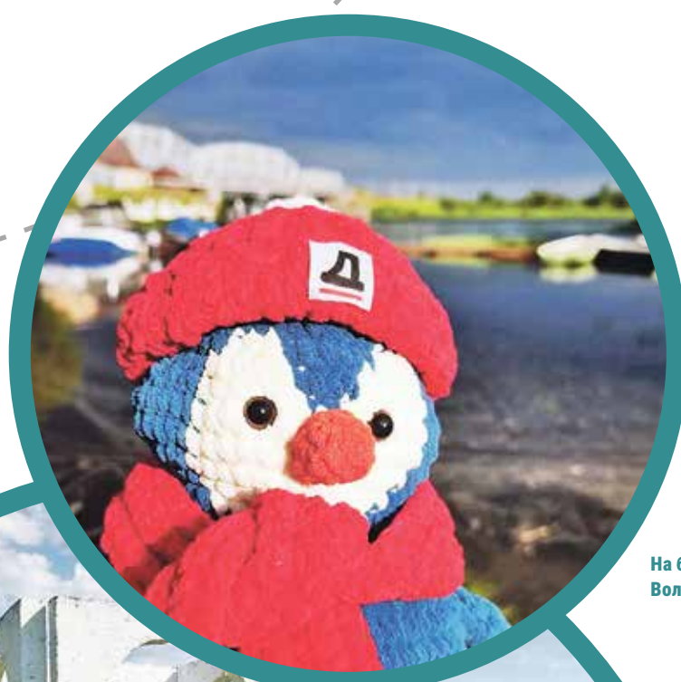
На берегу реки Волхов