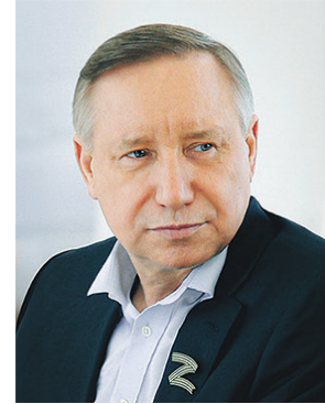
АЛЕКСАНДР БЕГЛОВ , губернатор Санкт-Петербурга