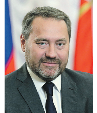
АЛЕКСАНДР БЕЛЬСКИЙ , председатель Законодательного собрания Санкт-Петербурга