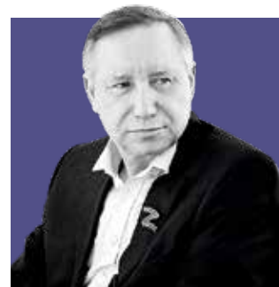
АЛЕКСАНДР БЕГЛОВ, губернатор Санкт-Петербурга

Новое поколение готово подхватить эстафету