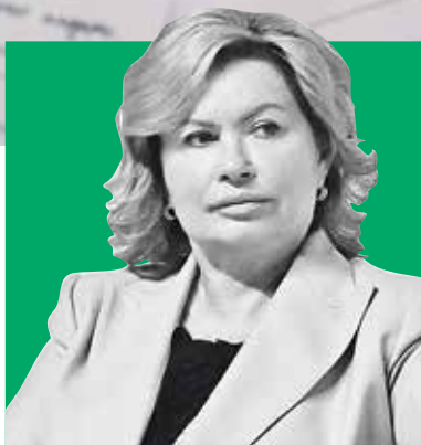
НАТАЛЬЯ ЧЕЧИНА, вице-губернатор Санкт-Петербурга