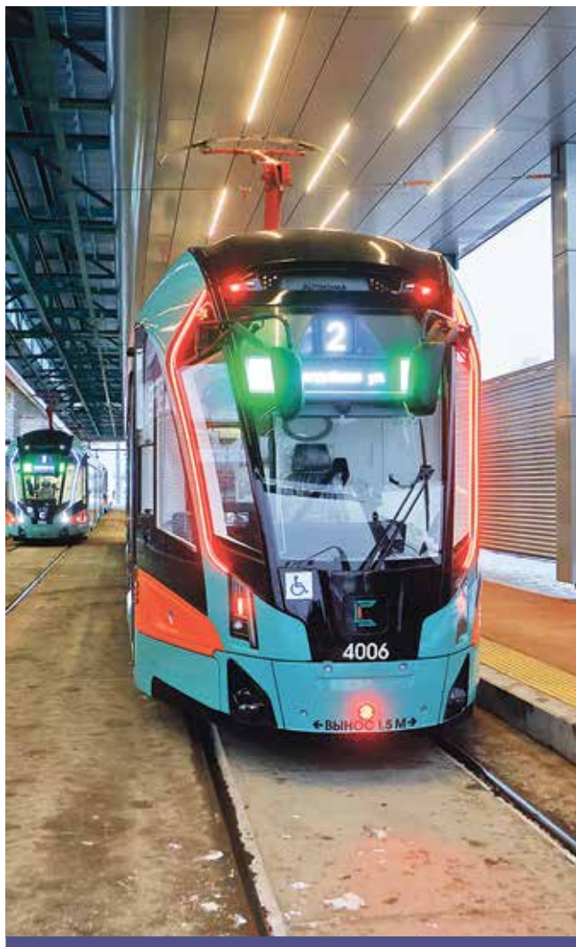
Длина нового участка трамвайной линии составит 12,5 километра.

Александр Беглов отметил, что до конца года будет введена вторая очередь действующей концессии – трамвай пойдет от станции метро «Купчино» до Славянки. Глава города напомнил, что в Пушкинском и Колпинском районах построено пять улиц общей протяженностью почти 22 километра.