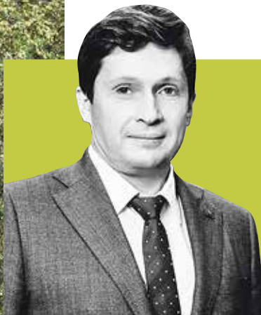
КИРИЛЛ СОЛОВЕЙЧИК, председатель Комитета по природопользованию, охране окружающей среды и обеспечению экологической безопасности