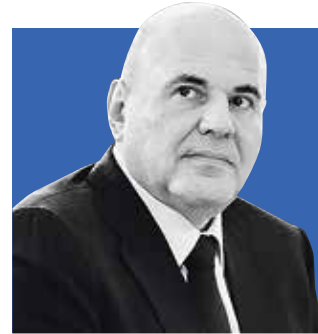
МИХАИЛ МИШУСТИН, председатель правительства Российской Федерации

В Петербурге прошла Международная конференция по укреплению культурных связей и развитию креативных и творческих индустрий. В ней приняли участие премьер-министры стран СНГ.