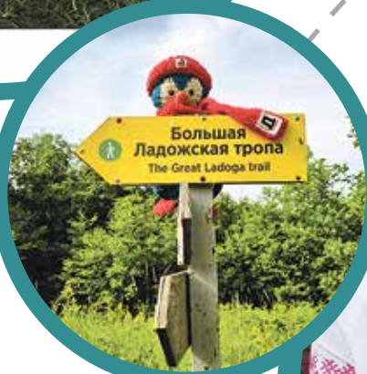
Участок Большой Ладожской тропы