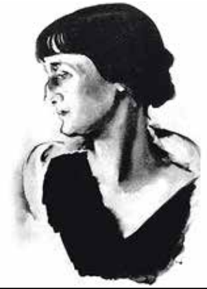
Н. ТЫРСА. ПОРТРЕТ А. АХМАТОВОЙ. 1928