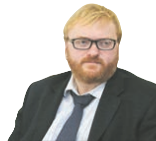
ВИТАЛИЙ МИЛОНОВ, ДЕПУТАТ ГД РФ

Мы готовы на базе этих зданий открыть школу молодых дипломатов как учреждение дополнительного образования. Люди могли бы изучать дипломатию не только в МГИМО, но и в Петербурге как окне в Европу.